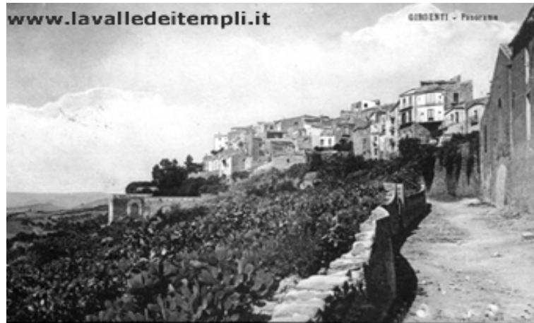
“ riconducibili al territorio agrigentino “

“ Itinerari e visite guidate alla scoperta di luoghi, scenari, vicende e personaggi pirandelliani